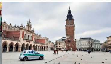
Samochód elektryczny w Krakowie