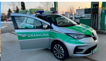
Nowe Renault Zoe w trasie