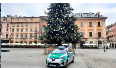
Nowe Renault Zoe w trasie