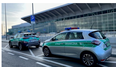
Nowe samochody przy Lotnisku Chopina