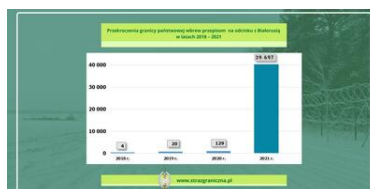
Przekroczenia granicy państwowej wbrew przepisom w latach 2018-2021, na odcinku z Białorusią

Z największą presją migracyjną zmagala się Placówka SG w Michałowie. Na odcinku przez nią ochranianym granicę nielegalnie próbowało przejść 5466 cudzoziemców. Duże natężenie prób miało miejsce ponadto w rejonie Placówki SG w Mielniku - 4890 cudzoziemców oraz Placówki SG w Białowieży - 4855 cudzoziemców .