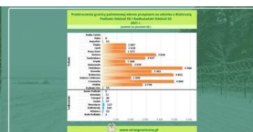
Przekroczenia granicy państwowej wbrew przepisom, na odcinku z Białorusią, wg podziału na placówki SG