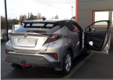
Wpadli podczas rozładunku kradzionych aut