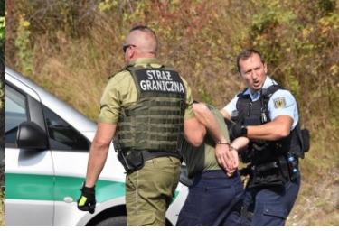
Ćwiczenia służb Ludwigsdorf