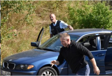
Ćwiczenia służb Ludwigsdorf