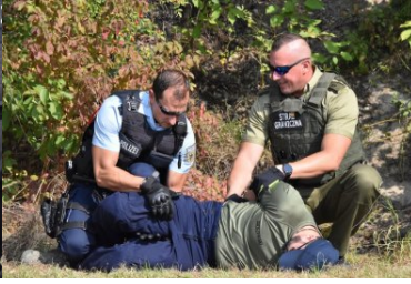
Ćwiczenia służb Ludwigsdorf