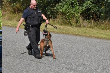
Ćwiczenia służb Ludwigsdorf