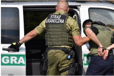
Ćwiczenia służb Ludwigsdorf