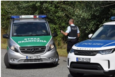
Ćwiczenia służb Ludwigsdorf