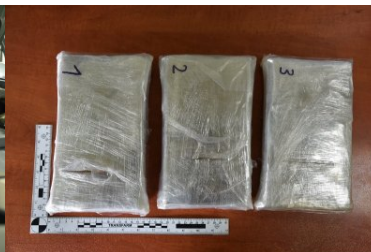
Kokaina ukryta w samochodzie