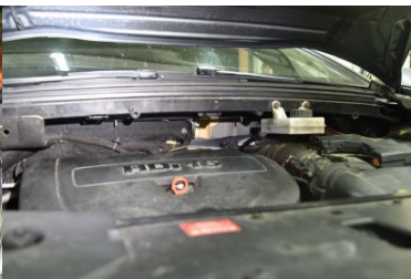
Kokaina ukryta w samochodzie