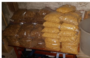
Nielegalny tytoń i krajanka tytoniowa