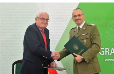
Podpisanie umowy na nowe samoloty