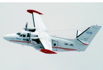
Takie samoloty wkrótce zobaczymy w barwach Straży Granicznej