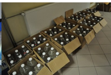
Zabezpieczone papierosy i alkohol bez akcyzy