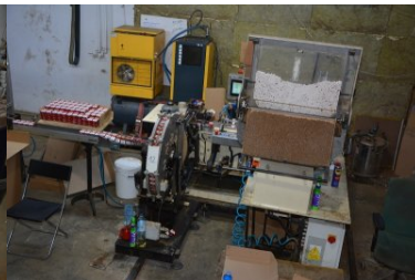
nielegalna fabryka papierosów