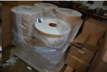
nielegalna fabryka papierosów