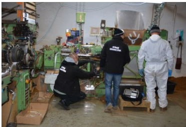
nielegalna fabryka papierosów