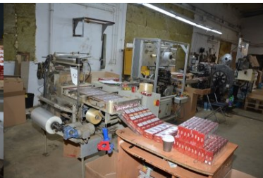
nielegalna fabryka papierosów