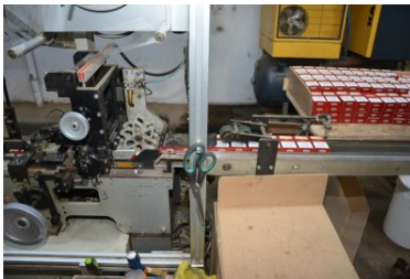
nielegalna fabryka papierosów