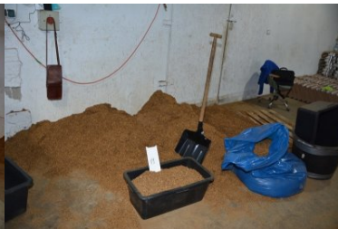
nielegalna fabryka papierosów