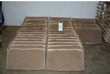
nielegalna fabryka papierosów