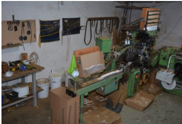
nielegalna fabryka papierosów