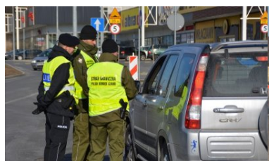
ćwiczenia z tymczasowego przywrócenia kontroli granicznej - Śląski OSG marzec 2018