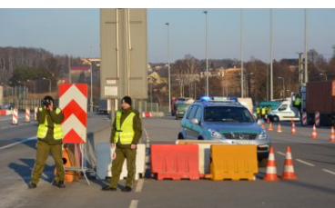
ćwiczenia z tymczasowego przywrócenia kontroli granicznej - Śląski OSG marzec 2018