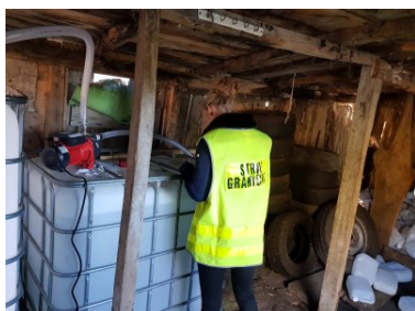
zlikwidowano nielegalną rozlewnię spirytusu