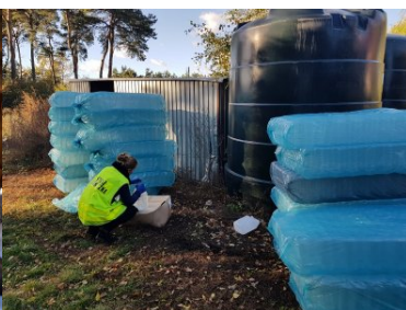
zlikwidowano nielegalną rozlewnię spirytusu