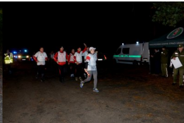
Przekazanie pałeczki sztafetowej funkcjonariuszom z Morskiego OSG.