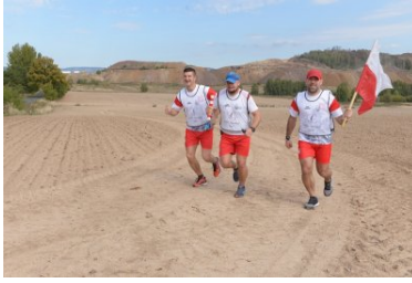
Sztafeta „Wokół Niepodległej” w Dolnośląskiem