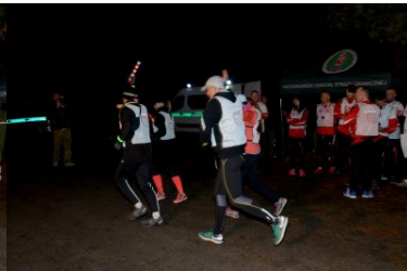
Sztafeta „Wokół Niepodległej” rusza do Zachodniopomorskiego