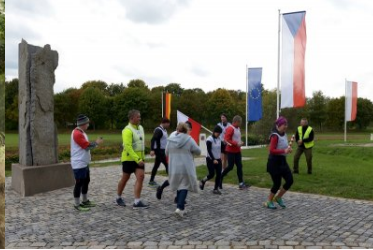
Sztafeta „Wokół Niepodległej” w Dolnośląskiem