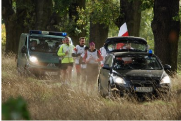
Sztafeta „Wokół Niepodległej” w Dolnośląskiem