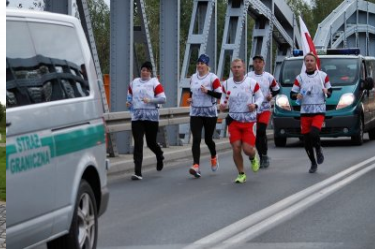
Sztafeta „Wokół Niepodległej” w Dolnośląskiem