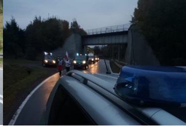
Sztafeta „Wokół Niepodległej” w Dolnośląskiem