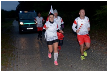
Sztafeta „Wokół Niepodległej” w Dolnośląskiem