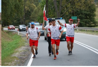
Sztafeta „Wokół Niepodległej” w Dolnośląskiem