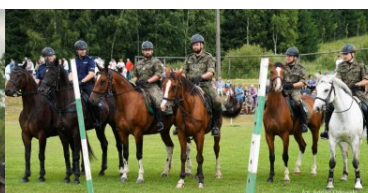
konie służbowe SG