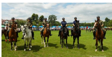
konie służbowe SG