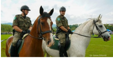
konie służbowe SG