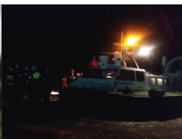
akcja ratownicza na Zalewie Wiślanym