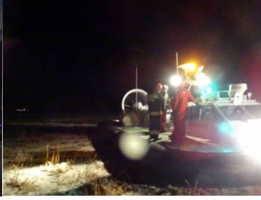
akcja ratownicza na Zalewie Wiślanym