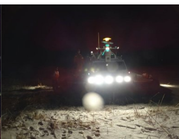
akcja ratownicza na Zalewie Wiślanym