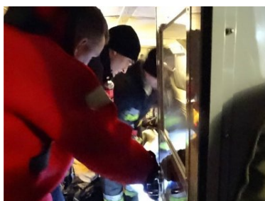
akcja ratownicza na Zalewie Wiślanym