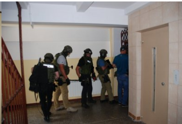
akcja zatrzymania członków grupy przestępczej