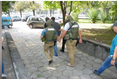
akcja zatrzymania członków grupy przestępczej