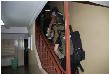
akcja zatrzymania członków grupy przestępczej