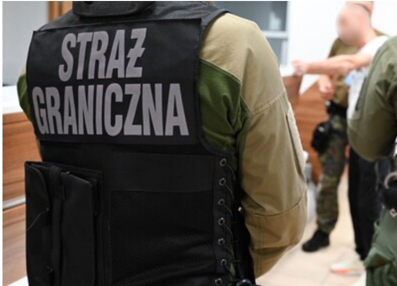
Deportacja z lotniska w Łodzi. Obywatele Gruzji odesłani do kraju