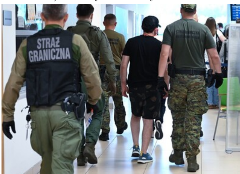
Deportacja z lotniska w Łodzi. Obywatele Gruzji odesłani do kraju