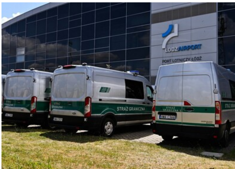
Deportacja z lotniska w Łodzi. Obywatele Gruzji odesłani do kraju