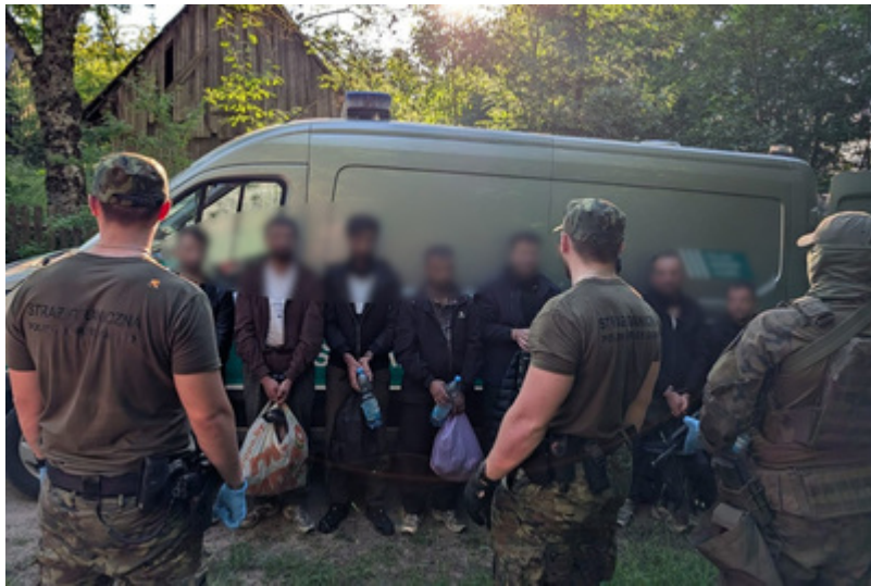
Podsumowanie weekendu na granicy polsko-litewskiej