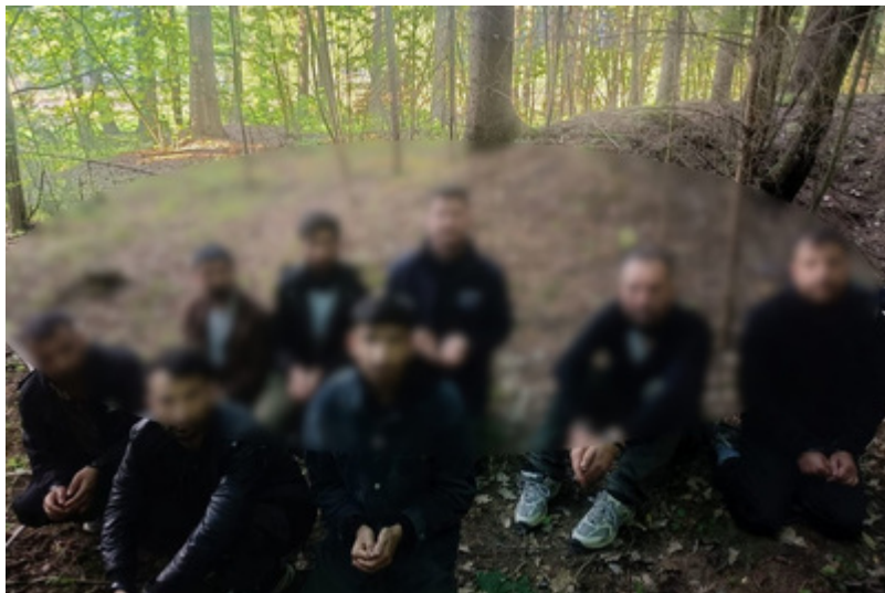
Podsumowanie weekendu na granicy polsko-litewskiej