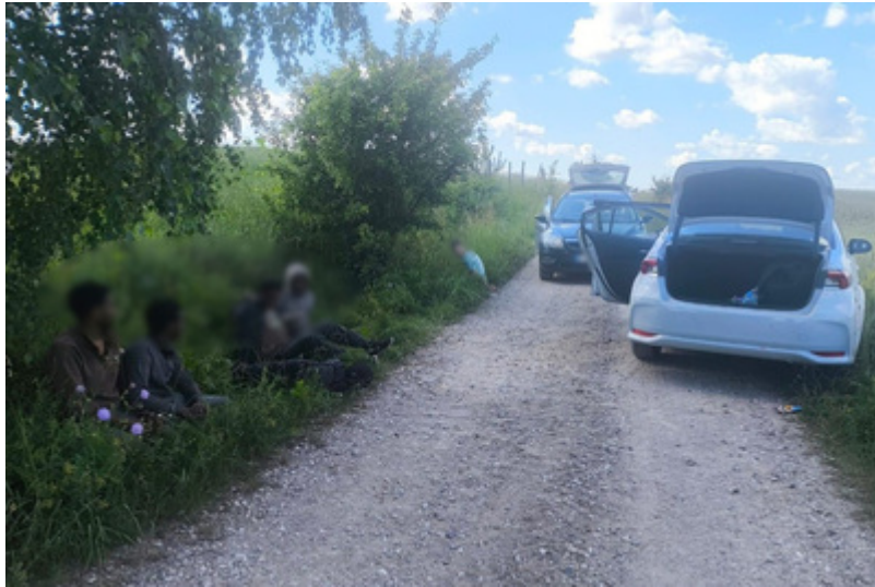
Podsumowanie weekendu na granicy polsko-litewskiej