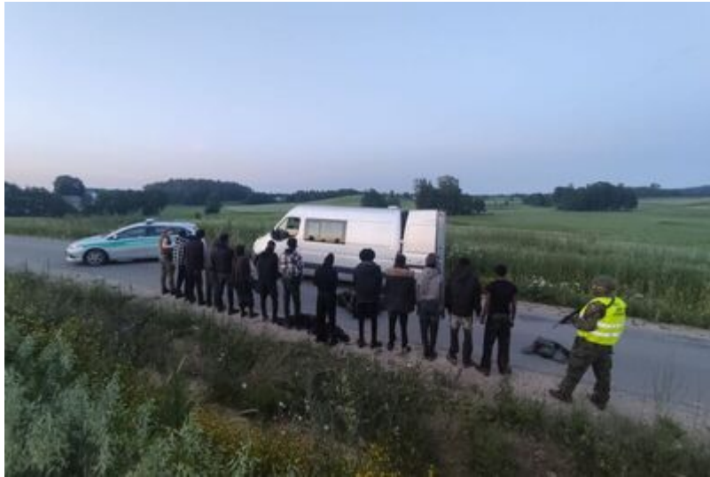
Podsumowanie weekendu na granicy polsko-litewskiej