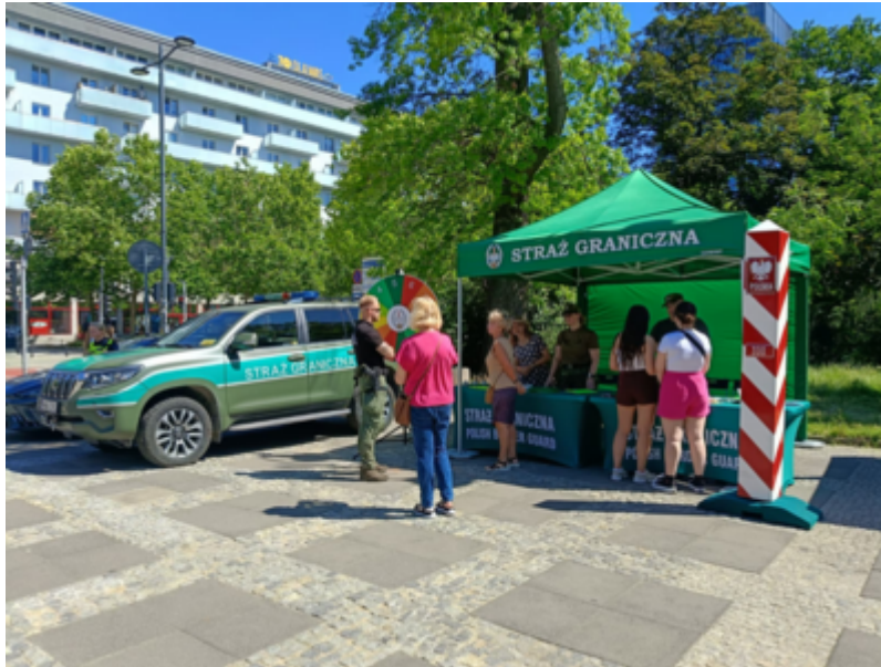
Straż Graniczna w bezpiecznym Śródmieściu