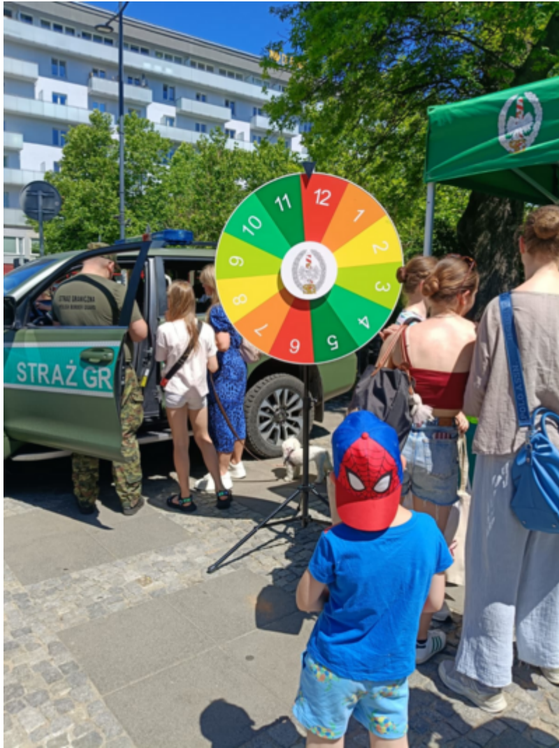
Straż Graniczna w bezpiecznym Śródmieściu