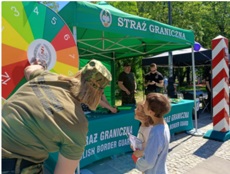
Straż Graniczna w bezpiecznym Śródmieściu