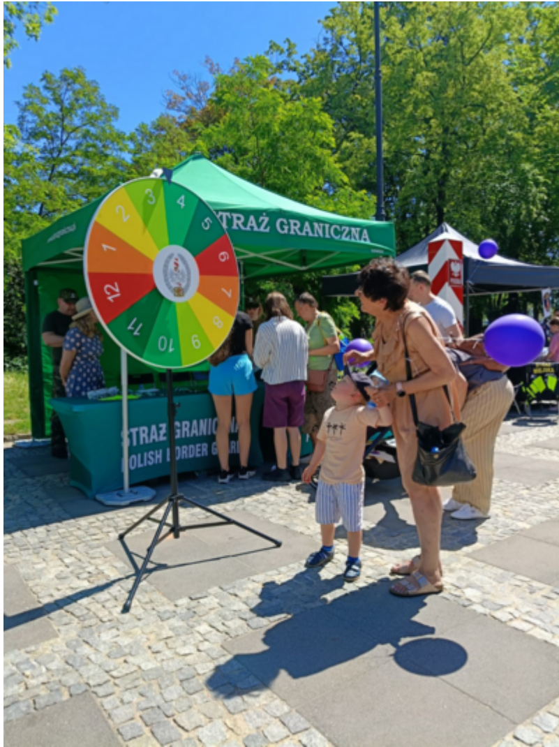
Straż Graniczna w bezpiecznym Śródmieściu