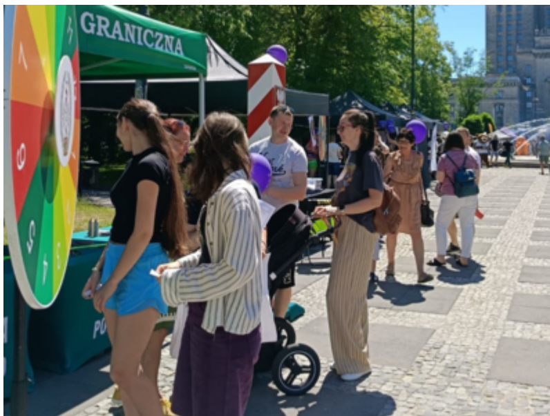
Straż Graniczna w bezpiecznym Śródmieściu