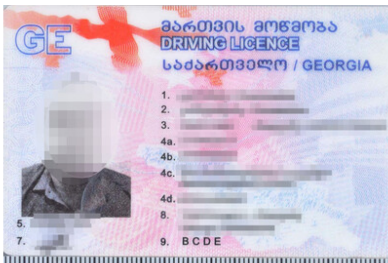
Ponad 250 fałszywych praw jazdy

Od początku 2026 roku podkarpaccy strażnicy graniczni wykryli ponad 250 fałszywych praw jazdy wydanych rzekomo przez władze 11 państw, m.in. Polskę, Chorwację i Czechy.