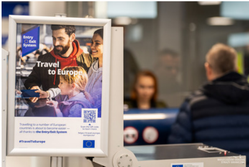
Zmieniili nazwisko, aby przekroczyć granicę