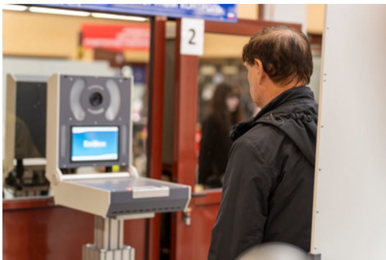
Zmienili nazwisko, aby przekroczyć granicę

To kolejny tego typu przypadek wykryty z wykorzystaniem systemu Entry/Exit. Ostatnie tego typu zdarzenie odnotowano na początku maja, kiedy w ten sam sposób granicę usiłowało przekroczyć mołdawskie małżeństwo.