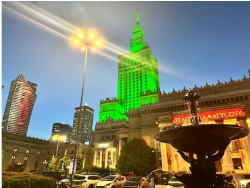
Zielona iluminacja Pałacu Kultury i Nauki z okazji 35-lecia Straży Granicznej