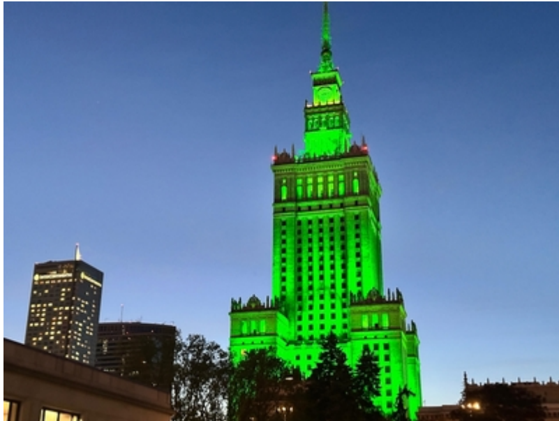
Zielona iluminacja Pałacu Kultury i Nauki z okazji 35-lecia Straży Granicznej