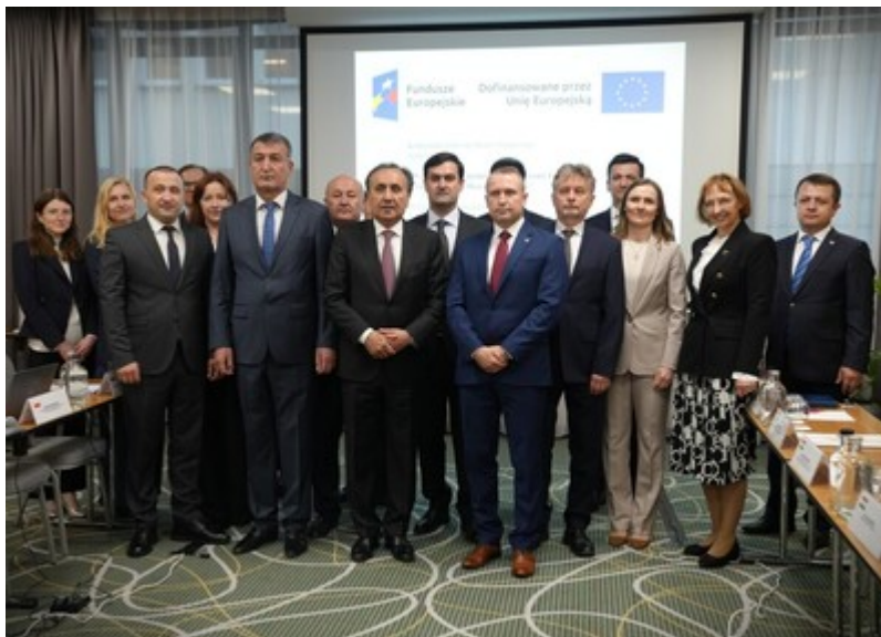
Zakończenie negocjacji polsko-tadżyckiej Umowy o readmisji