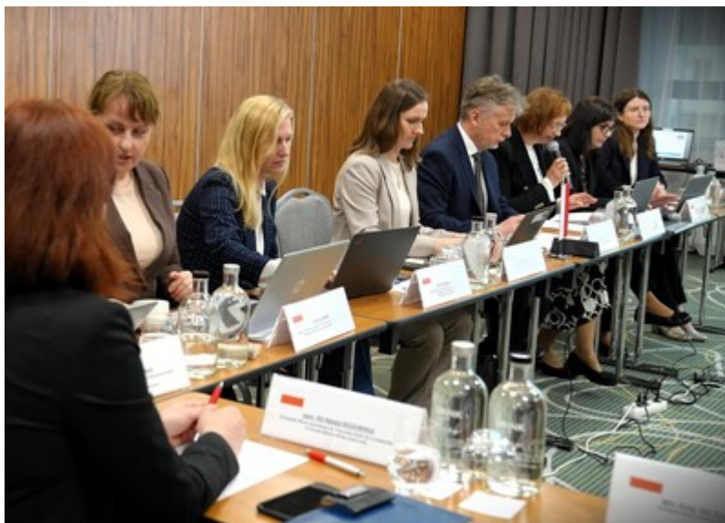
Zakończenie negocjacji polsko-tadżyckiej Umowy o readmisji