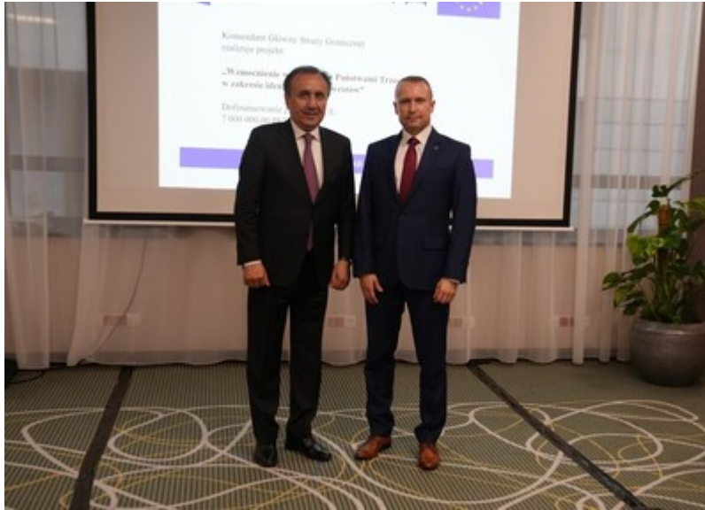
Zakończenie negocjacji polsko-tadżyckiej Umowy o readmisji