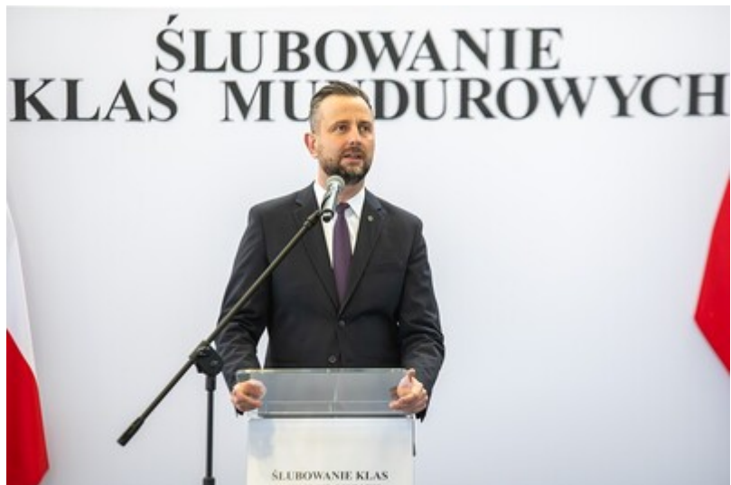
Ślubowanie uczniów klas mundurowych