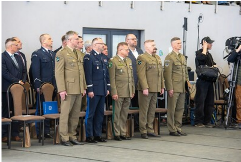
Ślubowanie uczniów klas mundurowych