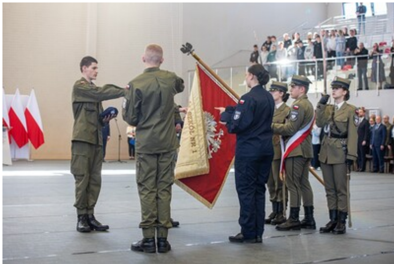
Ślubowanie uczniów klas mundurowych