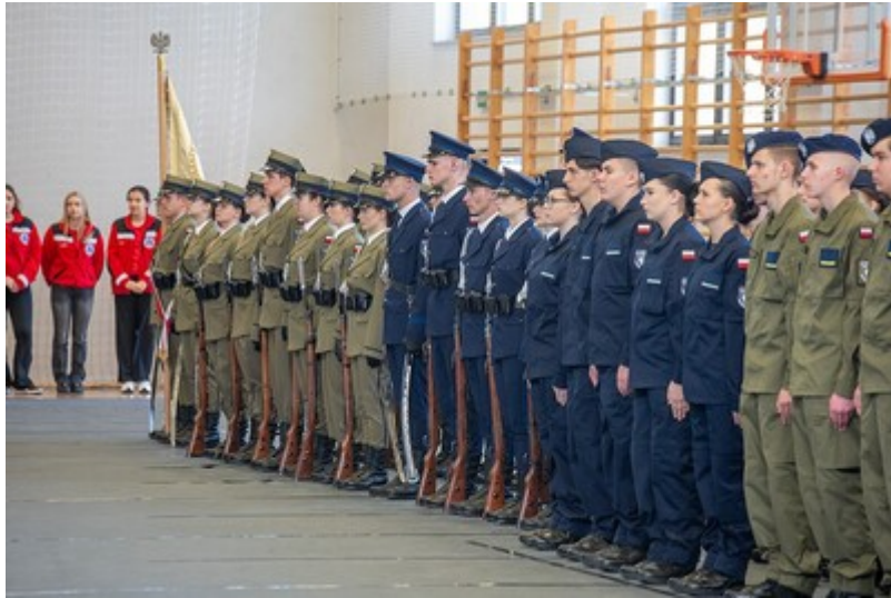
Ślubowanie uczniów klas mundurowych