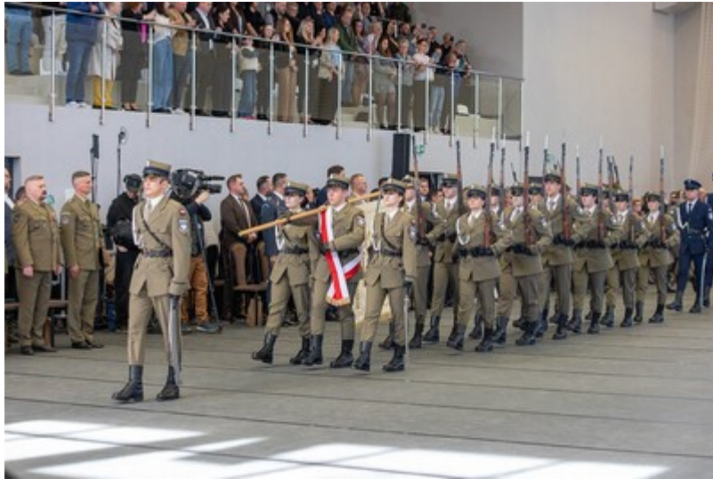
Ślubowanie uczniów klas mundurowych