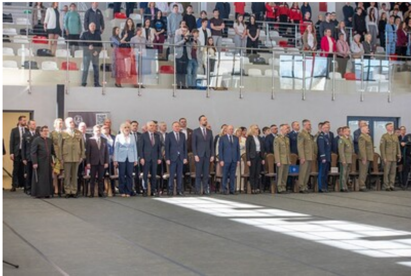
Ślubowanie uczniów klas mundurowych