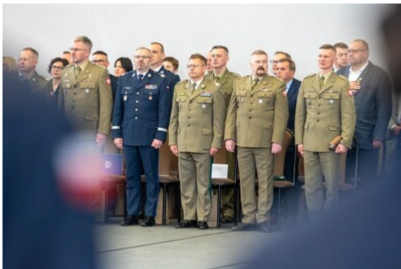
Ślubowanie uczniów klas mundurowych