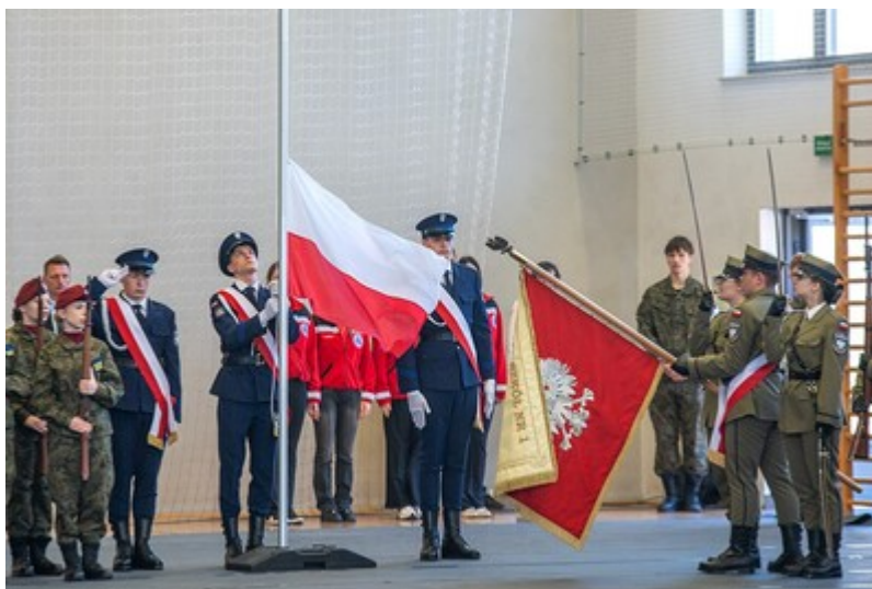
Ślubowanie uczniów klas mundurowych