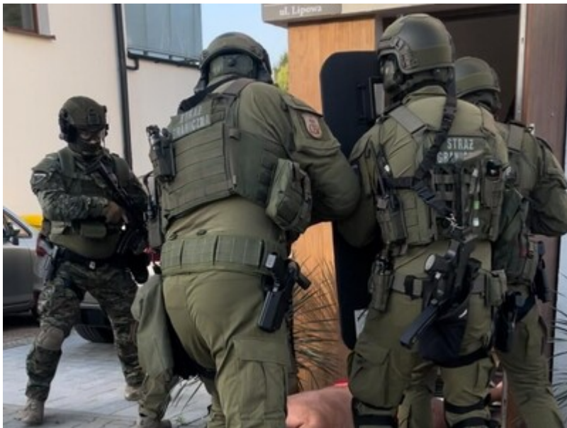
Funkcjonariusze Straży Granicznej podczas wykonywania czynności służbowych