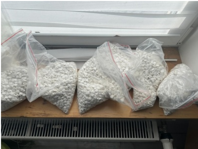
Zatrzymane środki odurzające