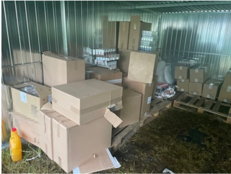
Zatrzymane nielegalne substancje i papierosy