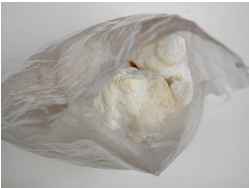
Zatrzymane środki odurzające