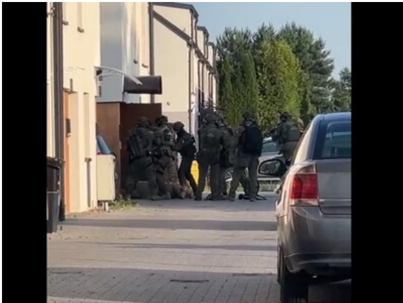
Funkcjonariusze Straży Granicznej podczas wykonywania czynności służbowych