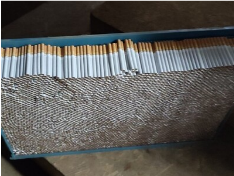
Zatrzymane nielegalne papierosy