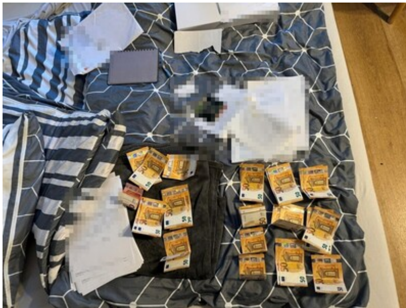
Zatrzymane środki finansowe

Przestępstwa popełnione przez oskarżonych zagrożone są karą pozbawienia wolności w wymiarze do 10 lat.