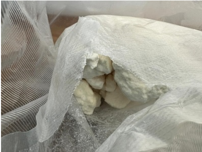
Zatrzymane środki odurzające