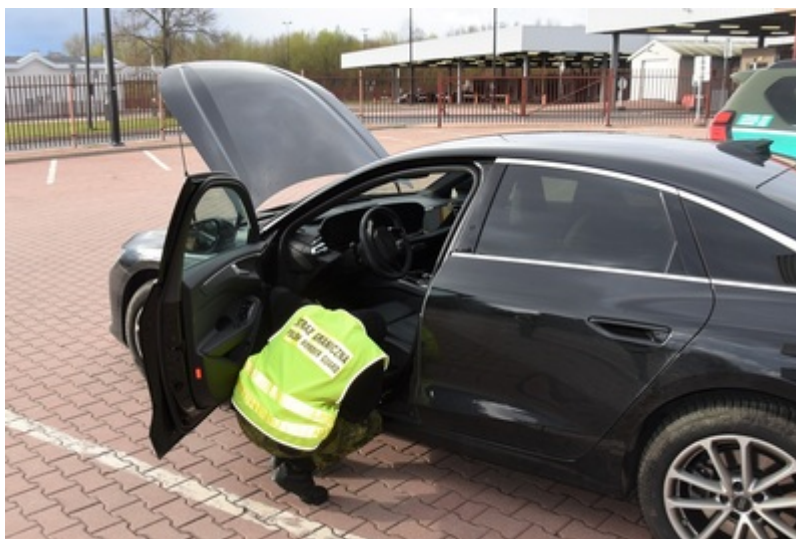
Funkcjonariusz SG przy zatrzymanym aucie