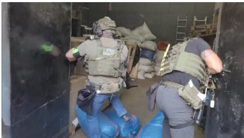
Funkcjonariusze Straży Granicznej podczas wykonywania czynności służbowych