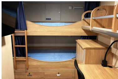
Kajuta w jednostce SG-301