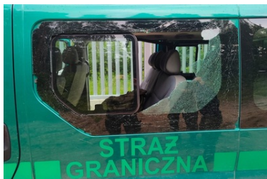
Uszkodzenia pojazdów w wyniku ataków na granicy polsko-białoruskiej