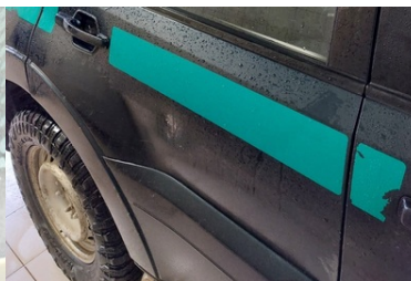
Uszkodzenia pojazdów w wyniku ataków na granicy polsko-białoruskiej