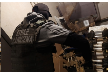
Funkcjonariusz SG zabezpiecza nielegalny towar