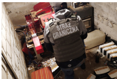
Funkcjonariusz SG zabezpiecza nielegalny towar