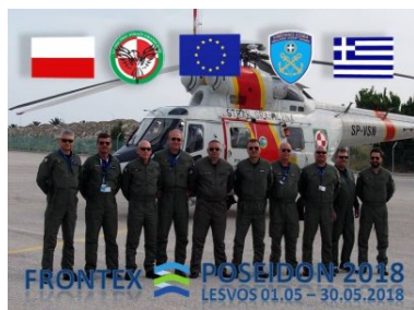
misja POSEIDON 2018