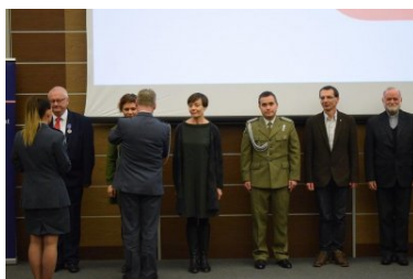
uroczyste obchody Święta Służby Więziennej