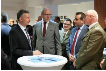
Polsko-Niemieckie Centrum Współpracy Służb Granicznych, Policyjnych i Celnych w Świecku