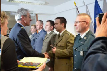
Polsko-Niemieckie Centrum Współpracy Służb Granicznych, Policyjnych i Celnych w Świecku